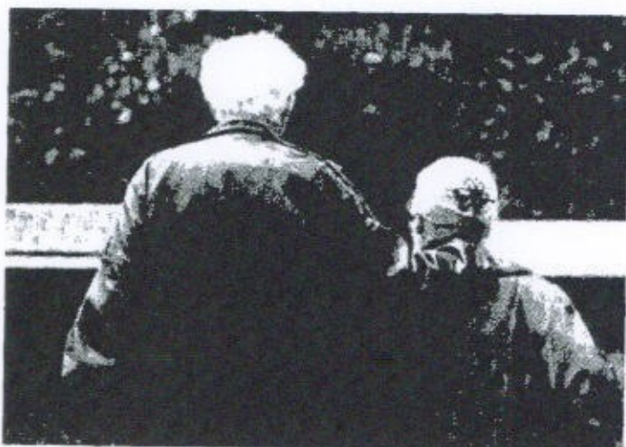
Vivono di più le donne ma si ammalano perché si sono trascurate per troppo tempo

Presentato il libro bianco che illustra la situazione della salute in Italia